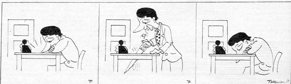
Der gerettete Mittagsschlaf.