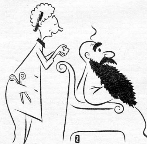
Haarschneiden oder Rasieren, bitte? Zeichnung: Otto Schwalbe

Wie viele der Anwesenden stimmten für den Vorschlag, wie viele dagegen?