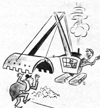
„Chef, wie wäre es mit einer kleinen Gehaltserhöhung?“ Zeichnung: Otto Schwalge

Die Wörter bedeuten: 1. Eigelb, 2. Umstandswort, 3. Laienmitglied des Gerichtes, 4. Fluß in Amerika, 5. Einfuhr, 6. Wirbelsturm, 7. Eisenblock, 8. Pflanze, 9. sagenhafte Stadt im Toten Meer, 10. Scheunenboden, 11. Bienenzüchter, 12. österreichischer Mädchenname, 13. Arznei, 14. Ungleichheit, 15. Schiff, 16. Absperrung, 17. Stadt in Pommern, 18. ital. Maler, 19. Aalgabel, 20. Sänger, 21. belg. Sozialist, 22. Bucht an der Ostküste Englands, 23. Übersetzer, 24. Insel im Mittelmeer, 25. plastische Darstellung, 26. gymnastischer Künstler.