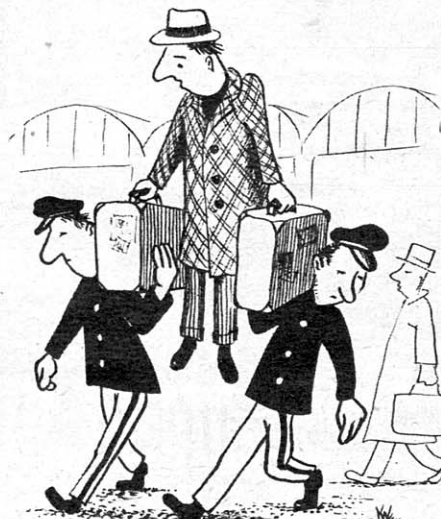
Die übereifrigen Kofferträger Zeichnung: K. Weisgärber